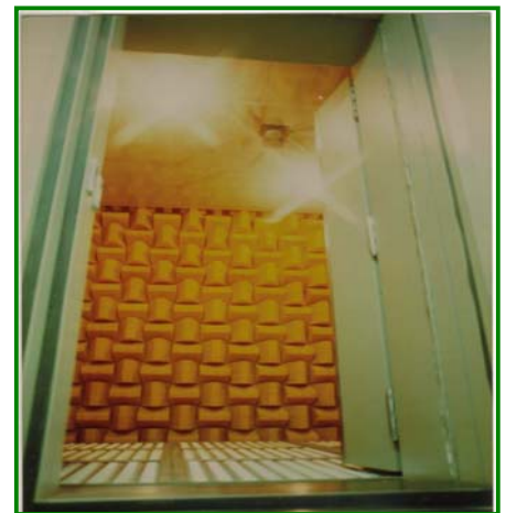
オプション吸音楔