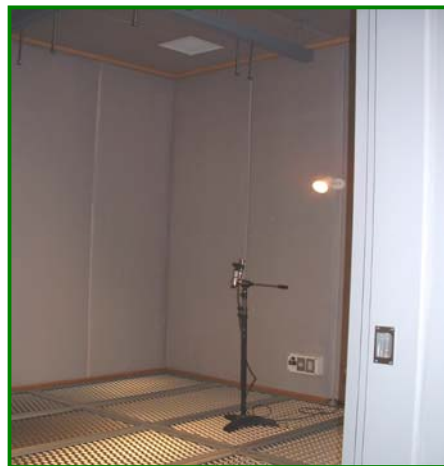
オプション歩行床